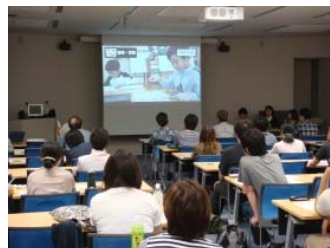
公開講座 子ども達との関わり方、 必要とする支援を知る