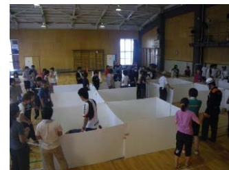
防災ボランティア 福祉避難所等の 設営を手伝う