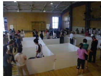
防災ボランティア 福祉避難所等の 設営を手伝う