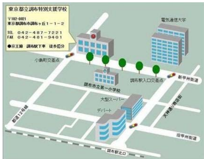
調布特別支援学校リソース・ネットの取り組み