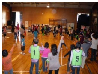
余暇活動支援 遊びを通じて子ども達と ふれあう