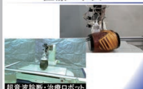
医師の世界観をロボットが再現